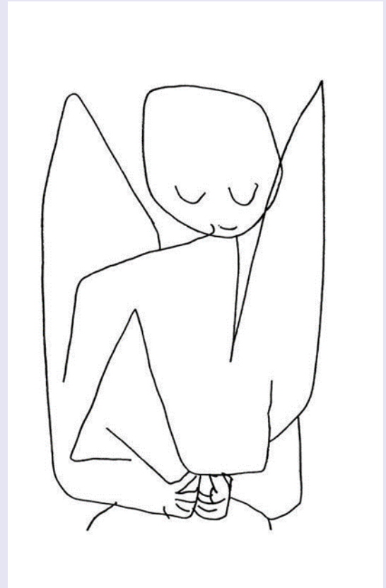
'Vergesslicher Engel' Paul Klee